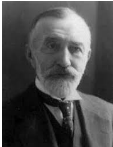
Abdülhak Hamit Tarhan (1852-12.04.1937)